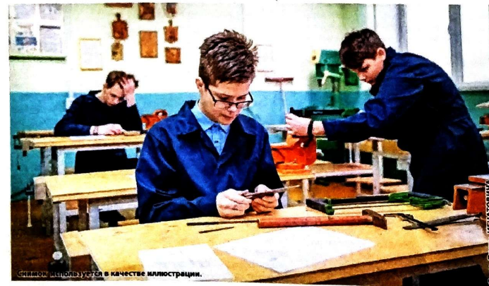
Ученики используют в качестве иллюстраций.

расследования и учета несчастного случая рассматриваются в судебном порядке. Кроме того, если в ходе проведения расследования несчастного случая установлено, что он не подпадает под действие пункта 4 Правил расследования и учета несчастных случаев, произошедших с обучающимися при освоении содержания образовательных программ, с воспитанниками при реализации программ воспитания, то результаты расследования оформляются актом служебного расследования произвольной формы (в предыдущей редакции указанных правил такой документ отсутствовал). Акт формы Н-2 утверждает руково-